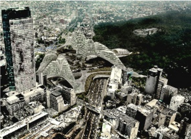
Cortés, Desapacho Rojkind

➤ La propuesta insistía en la necesidad de vivienda social en el Centro, como el Conjunto de Tlaltelolco, y en su presentación idearon una ciudad del futuro.